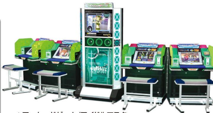
▲アーケードゲーム/アイドルマスター