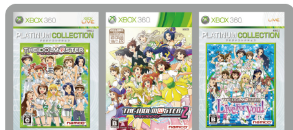
アイドルマスター Xbox 360 プラチナコレクション

DS『ディアリー・スターズ』は765プロの後輩・876プロがメインのスピノフストーリー。はなまる元気娘・日高 愛たち新人アイドルの視点から、アイドルの世界や友情を垣間見られる作品。